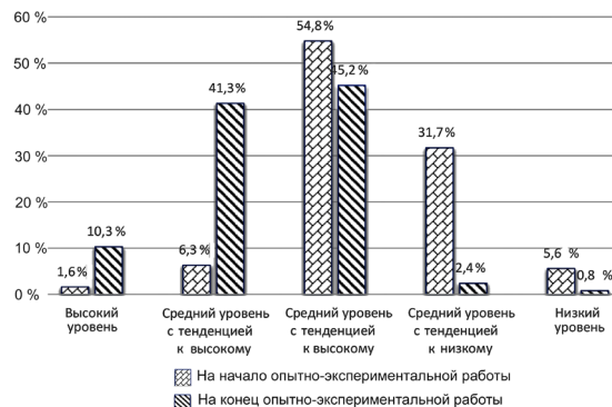
Рис. 3. Динамика формирования гендерной компетентности студентов

Таким образом, мы можем наблюдать положительную динамику формирования совокупности профессионально-личностных приращений в области гендерной компетентности студентов. На конец опытно-экспериментальной работы наблюдается увеличение числа обучающихся, имеющих высокий и средний с тенденцией к высокому уровни гендерной компетентности, и уменьшение числа обучающихся, имеющих средний, средний с тенденцией к низкому и низкий уровни гендерной компетентности (рис. 3).