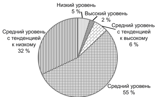
Рис. 1. Исходный уровень гендерной компетентности студентов Fig. 1. The initial level of gender competence of students

Результаты диагностики исходного уровня сформированности гендерной компетентности студентов, начинающих изучать дисциплину «Психология», и, соответственно, научные знания о гендере, свидетельствуют о том, что подавляющее большинство студентов имеют средний (54,8 %) и средний с тенденцией к низкому (31,7 %) уровни развития гендерной компетентности: в ответах респондентов содержится относительно мало (не более 35 %) эгалитарных гендерных представлений, прослеживается наличие большого количества гендерных стереотипов (до 75 % ответов) и ярко выражены гендерные предубеждения (до 75 % ответов) (рис. 1).