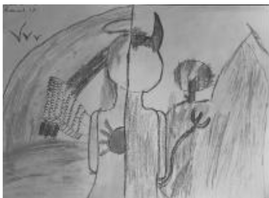
Рис. 2. Рисуночная методика «Добро и зло» (работа Амалии К.)