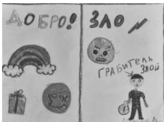
Рис. 3. Рисуночная методика «Добро и зло» (работа Даны Л.)