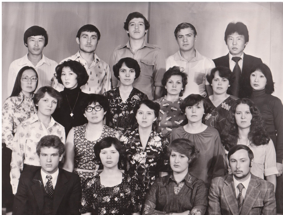
Рис. 3. Студенты 2-го курса ЕГФ (1976)

выделяли милиционера, с которым дружинники ходили по улицам, следили за порядком, посещали неблагополучные семьи.