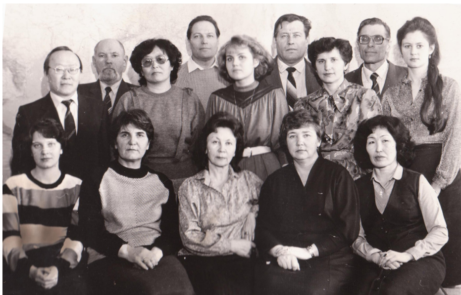
Рис. 7. Кафедра географии в 1988 г.