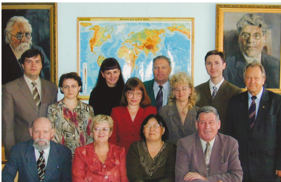
Рис. 8. Кафедра географии в 2003 г.