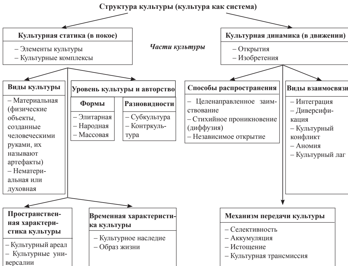
Рис. 1. Структурно-системное представление культуры (по Ю. В. Фененко) [19]

Основные положения. Большинство определений термина «культура» в традиционном понимании сводятся к тому, что культура – это создание искусства и просвещение (создание знаний), где традиционная система культурных институтов (в широком смысле – это традиции, обычаи, течения в науке и культуре, а в узком – библиотеки, музеи, учебные заведения, НИИ, партии и т. д.) транслирует созданное далее. Не рассматривая всё многообразие значений слова «культура», можно определить его как специфический способ организации и развития человеческой деятельности, представленный в продуктах материального и духовного труда, материальных и духовных ценностях, в системе социальных норм и учреждений, в совокупности отношения людей к окружающему миру [5]. Культура многоаспектна, поэтому всю систему культуры можно представить в виде условной схемы (рис. 1).